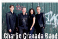
Charlie Granada Band

15:30 Uhr Beginn des Adlerschießen 20:00 Uhr Königsball mit der