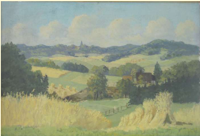
Abb.: Blick vom Schnettberg über Cronsundern und Ebbendorf Richtung Borgloh, um 1955