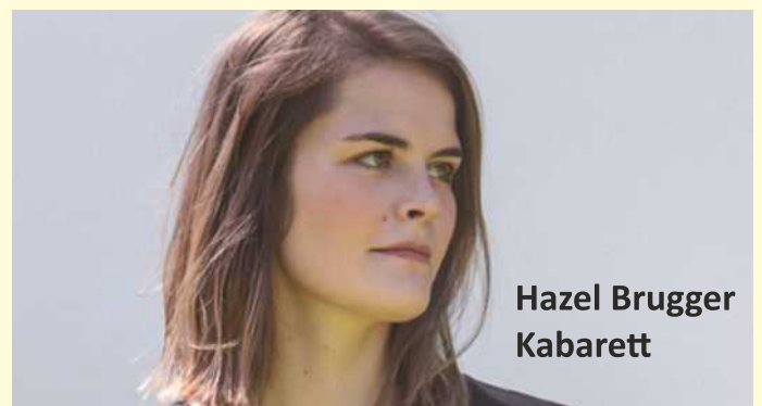
Hazel Brugger Kabarett

In ihrem ersten abendfüllenden Programm zieht Hazel Brugger aus, die Welt zu verbessern. Immerhin für einen Abend. Virtuos und stets bescheiden brüskiert und berührt sie, kreiert wilde Geschichten aus dem Nichts und findet schöne Worte für das Hässliche. Mit ihrem verspielten Charme penetriert sie kompromisslos die Psyche jedes Zuschauers – und der hat auch noch Spaß daran. Schonungslos, detailverliebt und mit viel Herz zerlegt Brugger die Welt in Einzelteile. Und führt ihr Publikum dabei stets über einen schmalen Grat, mal still, mal wild, aber immer sehr komisch. Weitere Termine, Eintritt: 21,60 €. Vorverkauf: Ticket-Service der OsnabrückHalle, Tourist Information Osnabrück, Tel. 0541 323-2202.