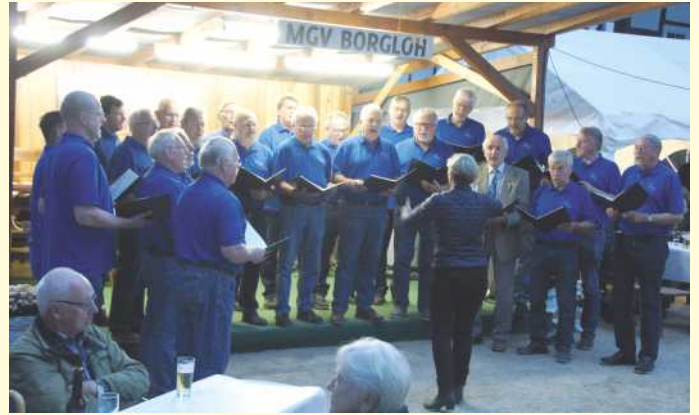
MGV Fidelitas Holte begrüßt MGV Borgloh.

Im Wechsel mit zwei weiteren Gastchören und der Blaskapelle Borgloh zeigten die Holter Sängerknaben einmal mehr ihre Begeisterungsfähigkeit. Der Platz an diesem sehr schön gelegenen See mit all seinen Anlagen ist ideal für schöne Sommerabende mit musikalischer Begleitung. Das Farbenspiel der Wasserorgel brachte zusätzlich noch einen optischen Zauber.