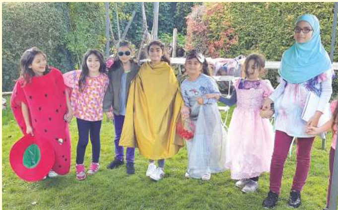
Garten Theatertruppe v.l. n. r.: Arabella, Arabian, Delayla, Rouhev, Nayla, Chanel, Amina, Lilas.

Auch in diesem Jahr brachte die Erdbeerernte im Schrebergarten der Energiebahn-Initiative nicht den gewünschten Erfolg, so dass das geplante Erdbeerfest zum Ende der Saison nicht aus eigenen Beständen ausgerichtet werden konnte.