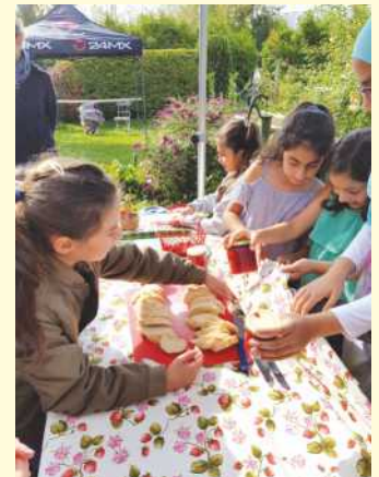
Herrichten der "Erdbeertafel"

„Fairy Berry ist verschwunden“ nannte sie das Stück, das sie gemeinsam mit anderen Mädchen im Alter von 7 bis 12 Jahren einstudiert hatte. Die märchenhafte Erdbeere Fairy Berry wurde in einem unbeachteten Moment entführt und in einen Zauberschlaf versetzt. Zum Glück half ein altes Hausmittel, nämlich selbst ge-