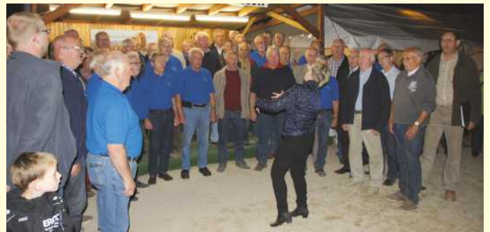
Chorgemeinschaft mit MGV Borgloh.

Die „ LaGa “ in Bad Iburg hatte noch einmal eine gesangliche Abendveranstaltung geplant. Ob der großen Bühne und des zu erwartenden Publikumsinteresse hatten sich die Holter mit den Sangesbrüdern aus Borgloh zu einer Chorgemeinschaft zusammengeschlossen.