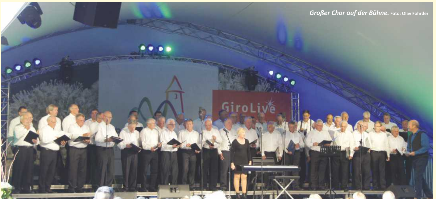
Großer Chor auf der Bühne.