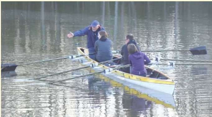
Die erste Ausfahrt im Ruderboot unter fachmännischer Anleitung.

Der traditionsreiche Wassersport fördert Kraft und Ausdauer, trainiert Herz und Kreislauf und die koordinativen Fähigkeiten und Kompetenzen. Bei kaum einer anderen Sportart werden nahezu alle Muskeln und das Gleichgewichtsorgan so gefordert wie beim Rudern. Zudem zeichnet sich der Rudersport durch ein äußerst geringes Verletzungsrisiko aus, nicht zuletzt deswegen trainieren Ruderer bis ins hohe Alter. Ein weiterer Reiz liegt in der Vielfalt des Sportgeräts: Ob im Einer, Doppelzweier, Vierer oder Achter, die verschiedenen Bootsklassen sorgen für Abwechslung und verleihen dem Training einen individuellen Charakter.