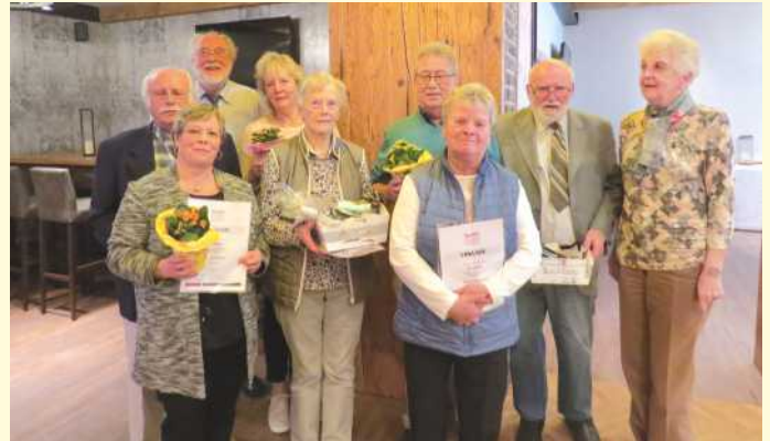
Jubilare im Saal.