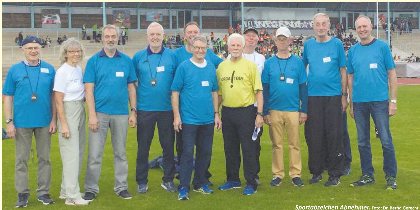
Sportabzeichen Abnehmer.