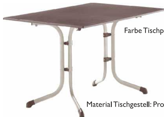
Farbe Tischplatte: Schiefer Mocca