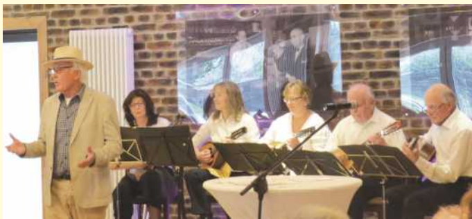
5 plus 1.