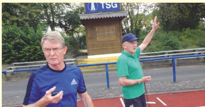
Prüfer in Aktion.

In den vier verschiedenen Bereichen Schnelligkeit, Kraft, Koordination und Ausdauer muss jeweils eine altersspezifische Mindestleistung erbracht werden, dazu der Schwimmnachweis einmal alle 5 Jahre. Eine Mitgliedschaft im Sportverein ist dazu übrigens nicht erforderlich. Es reicht der Spass am Sport, und mit etwas Übung schafft es fast jeder.