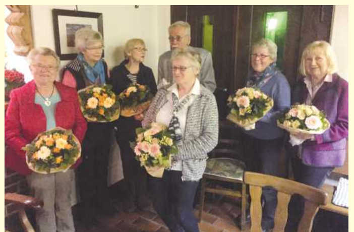
Dank den Vortragenden.