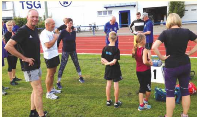
Gymnastik zum Aufwärmen.

Am Freitag nach Ostern geht es wieder los. Jeden Woche Freitag 18 Uhr warten die Abnehmer der TSG Burg Gretesch auf Euch, um die Bedingungen für das Deutsche Olympische Sportabzeichen abzunehmen.