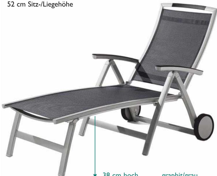
38 cm hoch