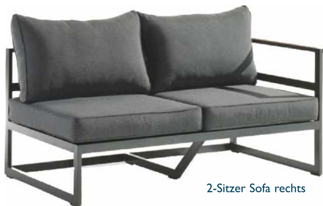
2-Sitzer Sofa rechts

Loungetisch 60 x 60 x 44 cm 349,- € 105 x 70 x 44 cm 479,- €