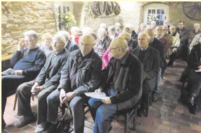
Plattdeutscher Abend in rustikaler Atmosphäre.

Insgesamt 15 Vortragende sorgten mit in bestem Platt und besten Dönkes für beste Unterhaltung.