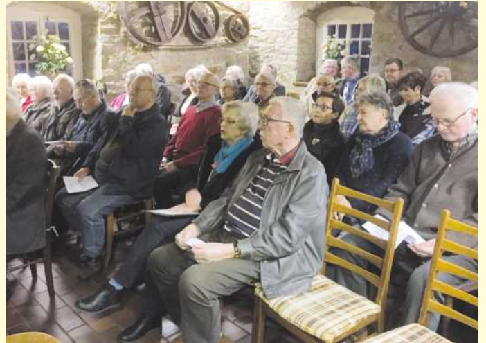
Gespannte Zuhörer.

Ostfreesland“, um nur drei der 11 Episoden des ersten Teils aufzuführen.