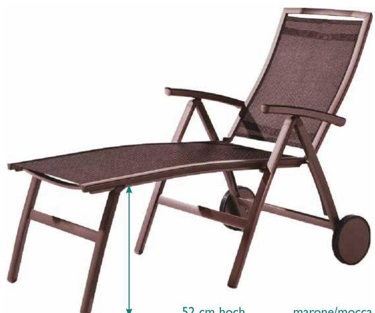
52 cm hoch