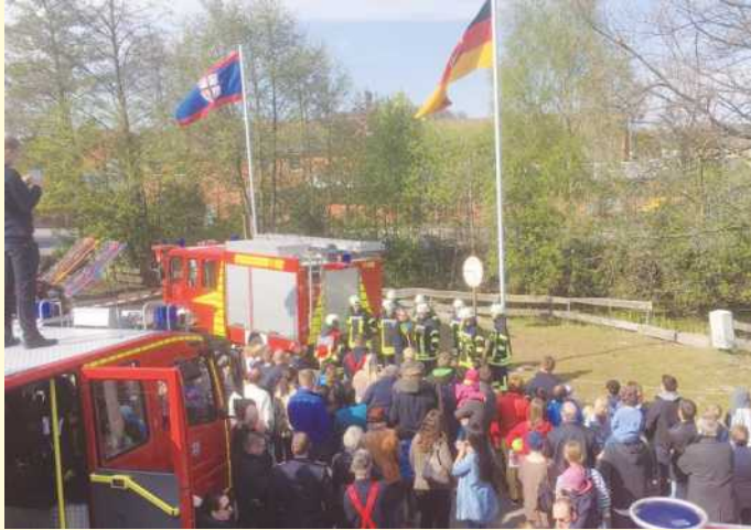
„Modernste Technik zum Anfassen“ gibt es bei der großen Fahrzeug- und Geräteshow beim Belmer Feuerwehrfest.

Das Belmer Feuerwehrfest startet am Dienstag, 30. April, um 15 Uhr mit einem Mitmach-Konzert für Kinder von „Zaches & Zinn-ober“ im beheizten Festzelt an der Waterloostraße. Einlass ist ab 14:30 Uhr, der Eintritt kostet 4 Euro.