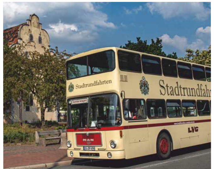
Wagen 99 wird bald wieder wissbegierige Fahrgäste durch und um Osnabrück chauffieren.

Die bisherige Kooperation mit dem Zoo Osnabrück bleibt in der Saison 2020 ebenfalls bestehen. Das heißt Zoo-Besucher erhalten gegen Vorlage des Stadtrundfahrten-Tickets einen Rabatt auf die Zoo-Tageskarte in Höhe von 1,50 Euro (für bis zu fünf Personen). Dieser Rabatt ist nicht mit anderen Ermäßigungen kombinierbar und nicht bar auszahlbar.