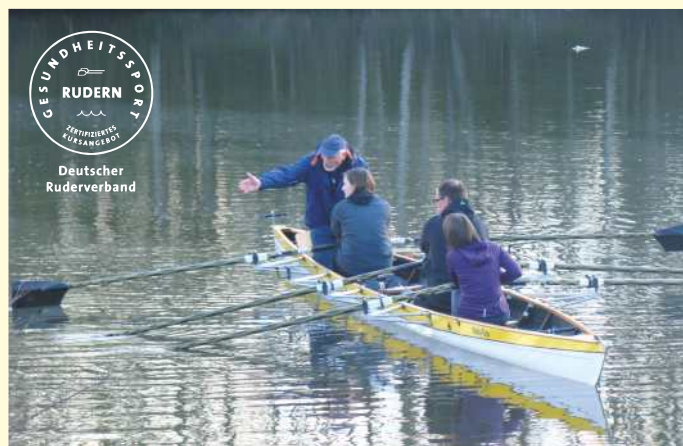
Die erste Ausfahrt im Ruderboot unter fachmännischer Anleitung.

Der traditionsreiche Wassersport fördert Kraft und Ausdauer und trainiert außerdem Herz, Kreislauf und Koordination. Bei kaum einer anderen Sportart werden nahezu alle Muskeln und das Gleichgewichtsorgan so gefordert wie beim Rudern. Weil sich der Rudersport durch ein äußerst geringes Verletzungsrisiko auszeichnet, ist er für fast jedes Alter geeignet. Ein weiterer Reiz liegt in der Vielfalt des Sportgeräts: Ob im Einer, Doppelzweier, Vierer oder Achter – die verschiedenen Bootsklassen bieten Abwechslung und verleihen dem Training einen individuellen Charakter.