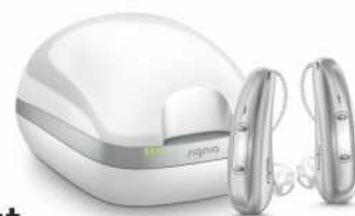
Signia Pure Charge&amp;Go X

Nachdem er das erste Mal mit den Signia Xperience Hörgeräten auf die Straßen der Münchner Innenstadt tritt, ist er begeistert. Er erlebt die Atmosphäre deutlich plastischer, echter, spürbarer. Sprache ist klar verständlich, gleichzeitig bekommt er alles um ihn herum mit. Auf das klare Sprachverstehen und den natürlichen Klang will er nun nicht mehr verzichten: „Vielleicht bräuchte ich noch keine Hörgeräte, aber ich möchte sie.“